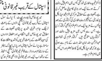
ایف آئی آر کے لیے آسانی پیدا ہوئی ہے۔ ایسے اقدامات نہ صرف ایف آئی آر کے اندراج کو آسان بناتے ہیں بلکہ جرائم کے خاتمے میں بھی میوزک ٹائم فراہم کر سکتے ہیں۔