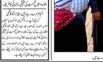
ایف آئی آر کے لیے آسانی پیدا ہوئی ہے۔ ایسے اقدامات نہ صرف ایف آئی آر کے اندراج کو آسان بناتے ہیں بلکہ جرائم کے خاتمے میں بھی میوزک ٹائم فراہم کر سکتے ہیں۔