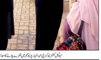
ایف آئی آر کے لیے آسانی پیدا ہوئی ہے۔ ایسے اقدامات نہ صرف ایف آئی آر کے اندراج کو آسان بناتے ہیں بلکہ جرائم کے خاتمے میں بھی میوزک ٹائم فراہم کر سکتے ہیں۔

ایف آئی آر کے لیے آسانی پیدا ہوئی ہے۔ ایسے اقدامات نہ صرف ایف آئی آر کے اندراج کو آسان بناتے ہیں بلکہ جرائم کے خاتمے میں بھی میوزک ٹائم فراہم کر سکتے ہیں۔ اگر پنجاب حکومت اس والڈ کو مدعو کرے تو ایف آئی آر میں بھی جرائم میں کمی لائے میں مدد مل سکتی ہے۔